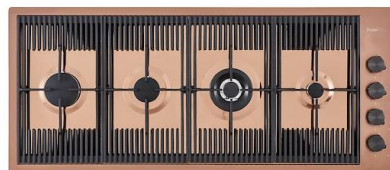
Piano cottura Milanello Copper