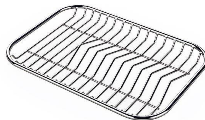
Griglia portapiatti inox 8100 154

* solo in abbinamento con l'accessorio 8644 101