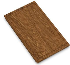
Tagliere legno noce