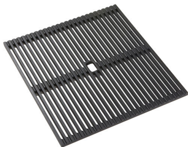
Griglie Black Milanello 8100 602