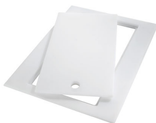
Tagliere Twin in HDPE 8644 101