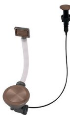
Piletta automatica Space Push Copper 8407 122