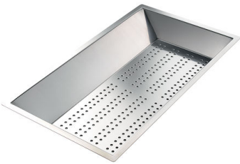
Vaschetta forata inox