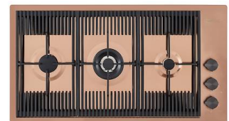
Piano cottura Milanello Copper