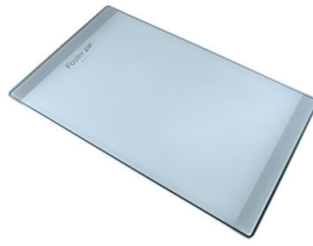
Tagliere in cristallo

* solo in abbinamento con l'accessorio 8644 101